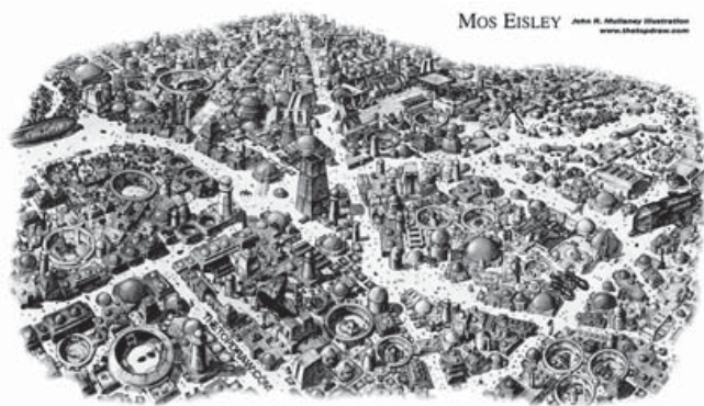
Figura 2. fotograma de Star Wars. Ciudad de Mos Eisley.

cotidianos. Esta experiencia es similar a la estructura de un “storyboard” o la dirección artística de una obra cinematográfica. Sin embargo esta guía de viaje no pretende restringir la improvisación y la creatividad, por el contrario busca brindar una serie de conceptos con los cuales ampliar el imaginario que se construirá mediante el dibujo.