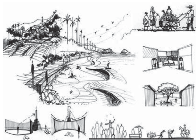
Figura 9. Ilustraciones del Sentido de lugar. Fuente: MEJIAS, Rodolfo. (2009) "Glosario Grafico de Imagen Urbana"