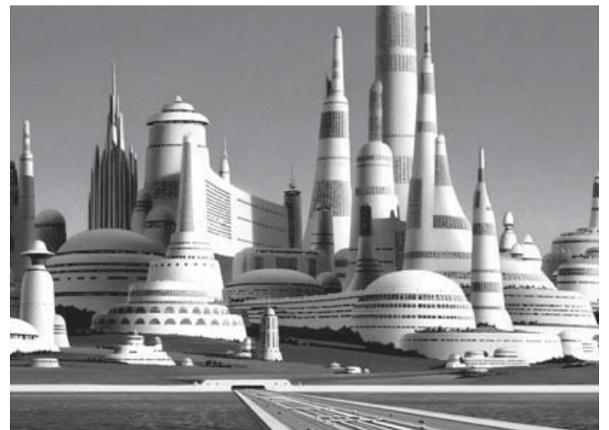
Figura 1. Imagen conceptual para Star Wars por el ilustrador Ralph McQuarrie.

Desde el punto de vista de un turista imaginario y sin haberse movido de su hoja de dibujo se puede aventurar a través del relato ficticio o real del lugar de nuestro interés. Esta guía de temas del imaginario urbano busca proporcionar conceptos estructurados que también permiten dibujar el discurso espacial oculto en la mente. El dibujo permite incursionar en la realidad deseada antes de que esta sea construida. Dibujar permite concretar la experiencia de viajar al futuro o al pasado, recrear mundos perdidos, reconstruir ciudades y edificios desaparecidos. Visitar mundos lejanos o mundos maravillosamente