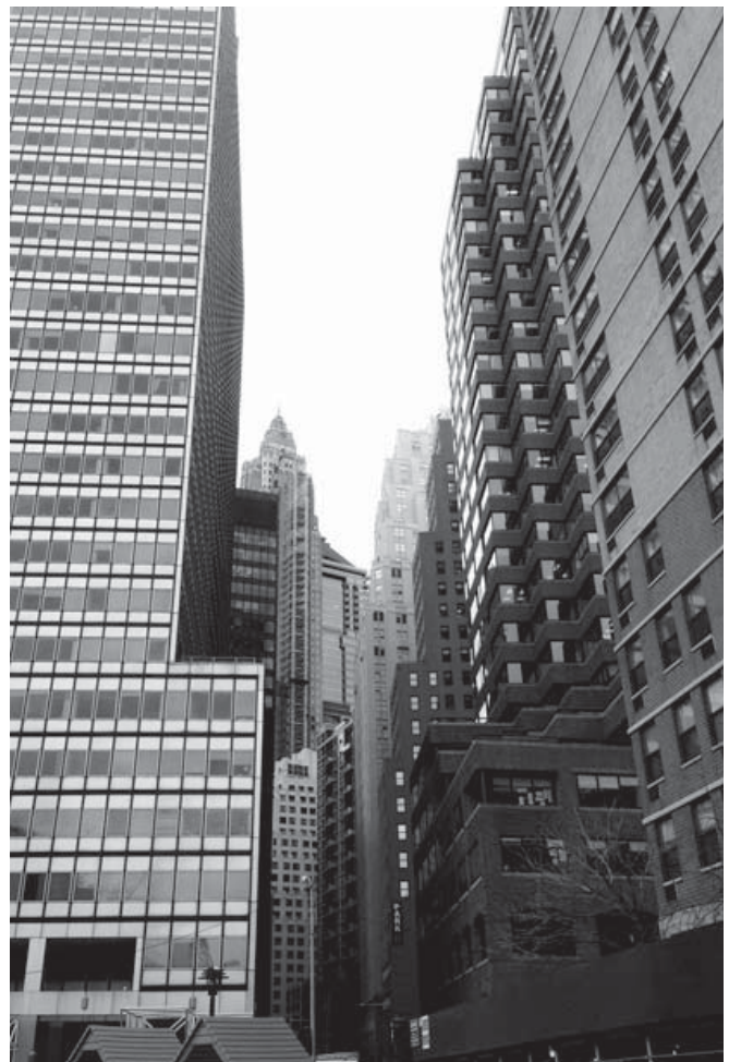
Figura 6. Vista de Wall Street, Nueva York. (2014).