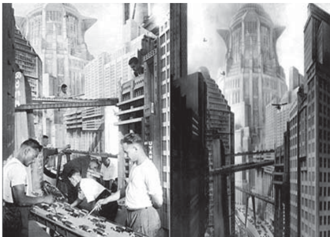
Figura 5. Fotograma de “Metrópolis” (1927) de Fritz Lang.

La fotografía, el cine o el video nos ayudan a recrear la experiencia de la imagen urbana. Pero aunque el cerebro mezcle velozmente la secuencia de 24 fotografías por segundo necesarias para crear la sensación de movimiento natural, así como tampoco se lograra sustituir la experiencia de la dinámica de un recorrido de vivencias reales y la posibilidad de permear todos los estímulos sensoriales (olores, sabores, colores, texturas y otros) que la ciudad brinda. Inclusive se puede correr el riesgo de crear el análisis a partir de una postal turística idealizada. Por lo tanto, cuando se selecciona un medio de representación este se convierte en herramienta para el análisis, por lo que el enfoque del tema a estudiar debe ser claro, ya sea este un levantamiento arquitectónico, un recorrido serial, destacar un elemento arquitectónico del contexto, resaltar un detalle o las vivencias de la gente. “Técnicamente podemos hacer paisajes completamente nuevos en un breve lapso, como en el caso de los “polders” holandeses. Aquí, los diseñadores ya se hallan ante el problema de cómo formar la escena total de modo que le resulte sencillo al observador humano identificar sus partes y estructurar el conjunto”. (Lynch [1960] 1989, 24) 4