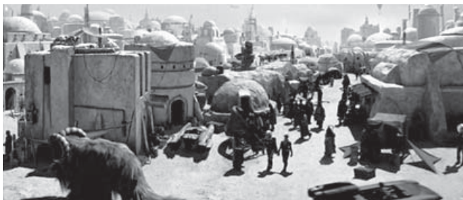
Figura 3. fotograma de Star Wars. Vista urbana de Mos Eisley.