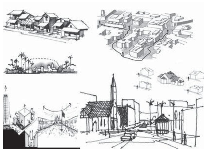
Figura 8. Ilustraciones de la Construcción Visual del lugar.

La fotografía tradicional es un arte caro, por lo que uso de la cámara digital permite la facilidad de la toma fotográfica y su almacenamiento en el computador. Para esta guía no interesan imágenes altamente complejas o elaboradas pues pueden distorsionar la descomposición de los componentes reales de la imagen, es preferible por tanto el dibujo en sitio realizado durante el recorrido tal como se observa.