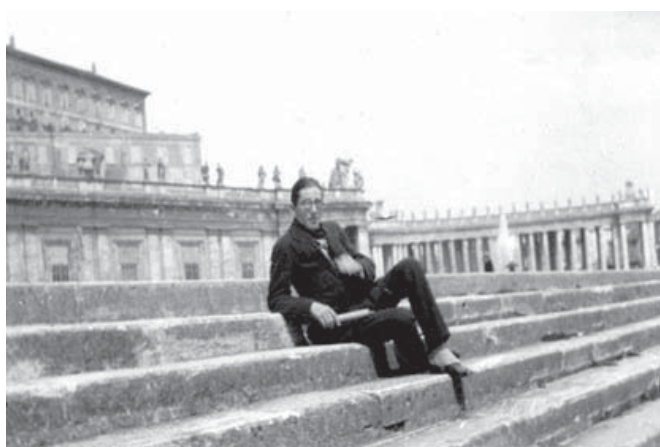
Figura 4. Le Corbusier a Roma, 1921. Fondation Le Corbusier. 3

bólico que la sociedad en general ha construido en torno a ellos como un valor agregado. En este sentido, un individuo con una formación académica en arquitectura o una persona con conocimientos básicos de “cultura arquitectónica”, puede crear la diferencia entre el turista masivo que invade los centros de interés arquitectónico o urbanístico de las ciudades, atraídos por la “imagen marca” de las agencias turísticas. Es decir, no se trata de hacer una pausa en el trayecto, tomarse una fotografía con el edificio de fondo y volver a subir al autobús a escuchar el audio guía. El arquitecto por su formación académica, recrea con frecuencia una estructura mental del imaginario social y cultural del lugar visitado. El dibujo de viaje se convierte para el arquitecto en un souvenir hecho en el sitio. Al igual que el souvenir tradicional permite al turista llevarse un recuerdo, el dibujo nos permite documentar la experiencia, traerla a casa y compartirla. “La historia y los monumentos no fueron cons-truidos para el consumo, en el sentido de convertirlos en artículos para llevar. Sin embargo esta conversión del turismo en producto hace tiempo que supone una serie de cosificaciones de objetos que “prueban” que ha tenido lugar un acto de presencia, un acto que potencia el status del turista una vez que vuelva a su país”. (Greenwood 2004, 9)