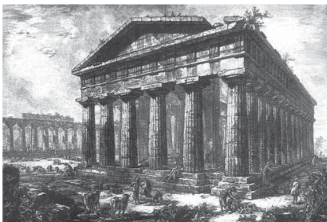
Figura 2. G. B. Piranesi, 1778, pl. X. Templo de Neptuno, Paestum