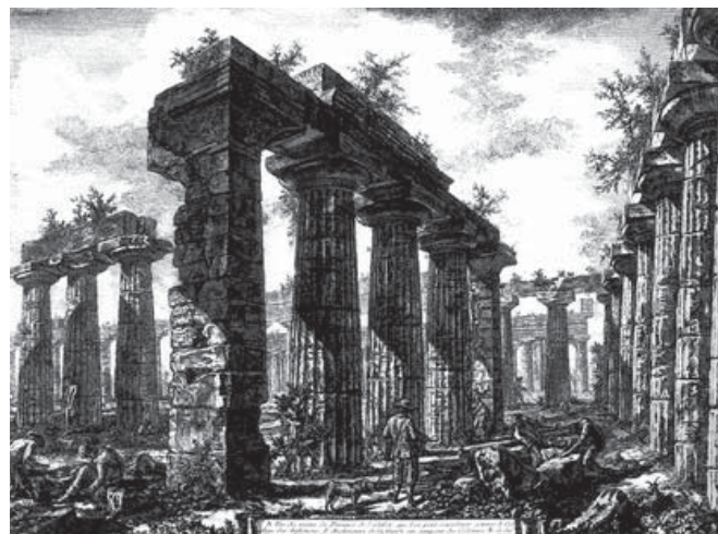
Figura 7. G. B. Piranesi, 1778, pl. V. La Basílica, Paestum.