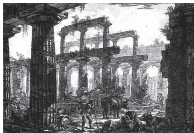
Figura 6. G. B. Piranesi, 1778, pl. XVII. Templo de Neptuno, Paestum.

mirando al interior del peristilo; angosto lugar desde el que se ven muy escorzadas las columnas del pronaos y el resto del ángulo del muro que cierra la cella alineado con ellas. Tal como se puede constatar en la planta, las tres columnas que aún se conservan del interior estarían parcialmente ocultas desde ese punto de observación, como nos muestra la fotografía de la figura 8. Piranesi en su dibujo las desplaza hacia la izquierda para que puedan visualizarse en su conjunto, lo que provoca que la distancia que las separa de las columnas del pronaos es mucho más grande que la existente en realidad. Evidentemente el artificio funciona y la imagen resultante muestra de modo mucho más efectivo la estructura del templo. Un dibujo más exacto y fiel a la realidad con seguridad ofrecería una información más limitada, lo que demuestra que el buen criterio del arquitecto ha generado una obra personal y subjetiva, pero que logra transmitir con vigor los valores del edificio y lo hace más comprensible.