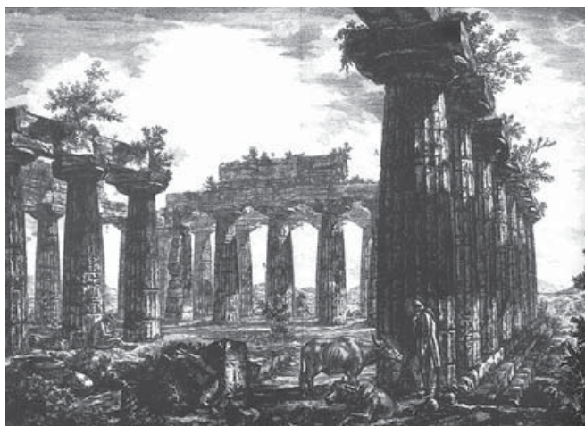
Figura 4. G. B. Piranesi, 1778, pl. VII. La Basilica, Paestum.