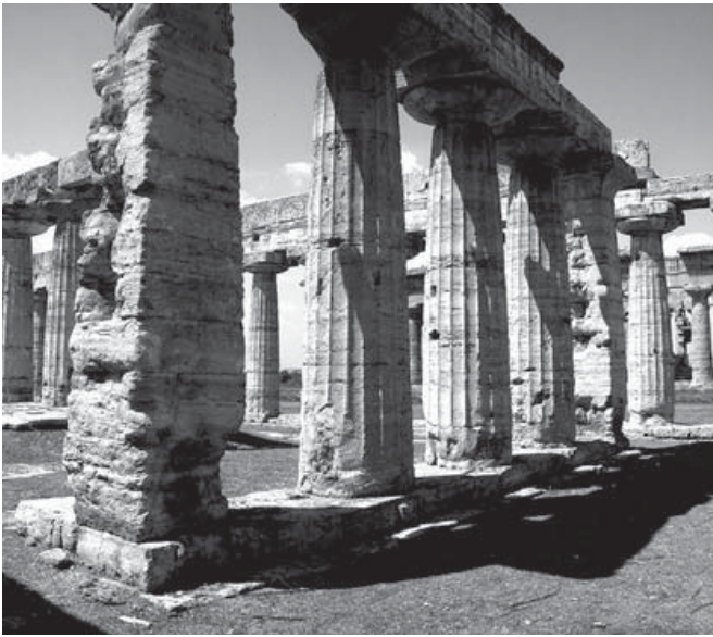
Figura 8. Fotografía del interior de la Basílica de Paestum desde un punto de vista similar al de la figura 7.