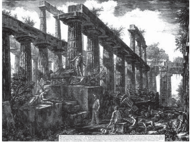
Figura 9. G. B. Piranesi, 1778, pl. XV. Templo de Neptuno, Paestum.

distancia con respecto al peristilo. Este efecto es llamativo en la base del muro de la cella, donde en el primer plano se sitúa una escalera y alguno de los personajes, muro que debería ser prolongación del resto conservado en la esquina del fondo y que, claramente, no lo es.