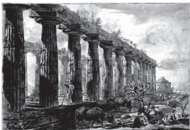
Figura 3. G. B. Piranesi, 1777. Dibujo preparatorio para la pl. XIX. Templo de Ceres, Paestum.

El grabado del templo conocido como la Basilica (figura 4) presenta también un punto de vista exterior al edificio, con un horizonte demasiado alto para una visión natural real, pues se sitúa casi a la mitad de altura de las columnas y por encima de las cabezas de las figuras que ambientan la escena, visión imposible de alcanzar exteriormente por la altura de