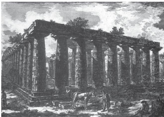
Figura 1. G. B. Piranesi, 1778, pl. II. La Basilica, Paestum.