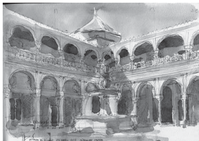
Figura 7. José María Lerdo de Tejada, 2013. Casa de Pilatos, Sevilla.