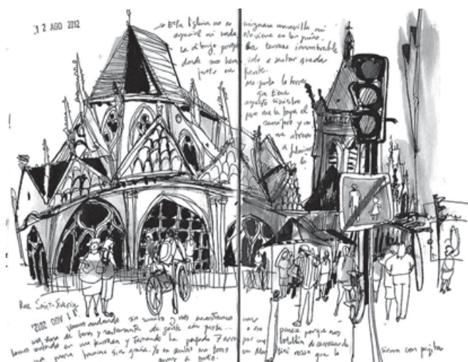
Figura 9. Inmaculada Serrano, 2012. Rue San Severin, París.

de gran riqueza (fig. 9 y 10). Existen aproximaciones más analíticas o más expresivas, y también ha habido quien ha propuesto la identificación de ciertos rasgos comunes dependiendo del entorno cultural de procedencia del dibujante, de la siguiente manera: “los europeos dibujan siguiendo normas establecidas, los americanos buscan un vehículo de expresión y los asiáticos simplemente quieren divertirse” 7 .