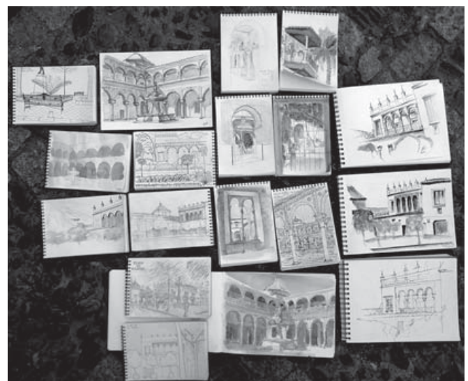
Figura 4. Cuadernos de dibujo de urban sketchers en la Casa de Pilatos de Sevilla (25-4-2013)