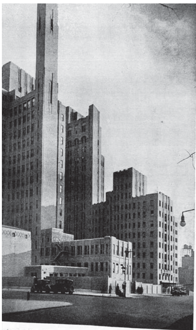
Figura6. Fotografía de la Central Médica de Nueva York publicada en la revista Arquitectura

trucción...” (Sánchez 1929a). Sobre estas edificaciones destaca los materiales, elegidos de manera apropiada y la disposición de espacios sin derroche. La inversión realizada en la construcción de estos edificios se recupera con el tiempo al estar basada en el aprovechamiento de espacios. La tercera parte del coste de construcción de un hospital es igual a su gasto anual, por eso es tan importante la elección de calidad de los materiales y la instalación mecánica. La estructura, que sigue un módulo, permite la elasticidad en la disposición de los espacios. El resultado una obra económica y de gran calidad.