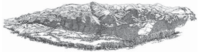
Figura 7. Vigaña de Arcello. El Camino Real del Puerto de La Mesa (1976). Dibujo a plumilla

taña de profunda belleza y amplias vistas. En este entorno la representación sintética de los espacios naturales realizada por los dos hermanos alcanzó su plena madurez. Estudio brillante, adelantado a su tiempo, de corte naturalista, hace partícipe a las construcciones autóctonas que analiza dentro de los postulados de un ecosistema territorial homogéneo; en la que arquitectura y paisaje se fusionan en una misma unidad (Figura 7).