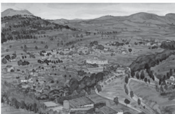
Figura 4. De arriba hacia abajo:

Tapia de Casariego. Playa de Mixota (1981). Acuarela. 52x32,5 cm.