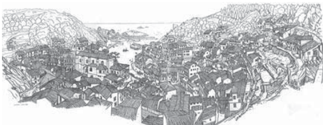
Figura 6. Cudillero. España dibujada (1969). Dibujo a plumilla.

Llevar un tablero para apoyarse cuando hacen grandes panorámicas, que tiene un metro treinta por ochenta centímetros. Trabajan sentados con él sobre las rodillas, o apoyándose (si hay suerte) en algún muro bajo. 'Si hay viento lo apoyamos en el suelo y trabajamos de rodillas'. Llevan también un rollo de papel de envolver y usan su cara rugosa o satinada según utilicen lápiz blando o duro, bolígrafo o pluma. De ese modo, dicen, como es barato, 'no nos da apuro empezar a emborronar'. Este papelote lo enrollan a los extremos del tablero y, como quien hace pasar el rollo de película de una cámara fotográfica, van haciendo de corrido, sin volver a confrontar con lo primero, sin levantarse a mirar desde lejos, unas vistas generales que tienen hasta tres metros de longitud (García 1972, 1:14-15). El estilo escogido y la compenetración de los dos hermanos hacen que el trabajo parezca hecho por un solo dibujante de cuatro manos (García 1972, 1:16).