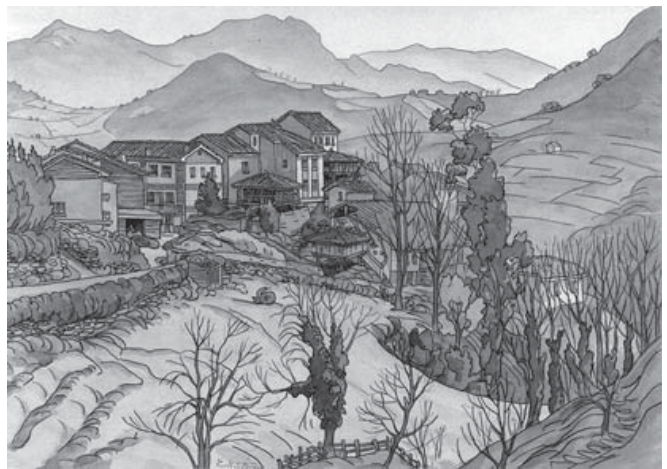
Figura 2. Castandiello. Somonte del Aramo (1987). Lápiz más acuarela. 68x48,5 cm.

mino realizado, su imagen-reflejo, su nota biográfica ilustrada. En Efrén, en su obra, esta técnica es proyección directa del trabajo de oficio acumulado en años de trabajo, enriquecido indirectamente por la propia experiencia vital que, en su caso, fue mucha. Al final supo sabiamente convertir ese bagaje de la experiencia y del aprendizaje en su razón de existir, pues, en sus propias palabras: "cualquier actividad del hombre siempre y cuando tenga un sentido trascendente aunque sea a pequeña escala, es satisfactoria" (Figura 2).